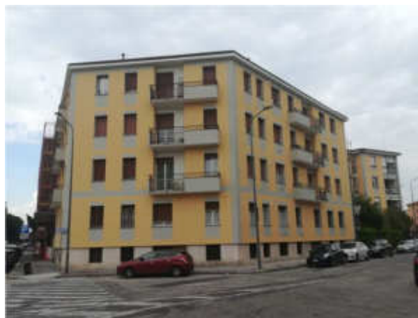
Dopo i lavori di riqualificazione

Tutto l'intervento ha mirato alla riqualificazione energetica degli edifici che compongono l'isolato urbano conformemente a quanto prescritto dal Decreto Regione Lombardia n.2456 dell'8 marzo 2017, con un unico filo conduttore estetico .