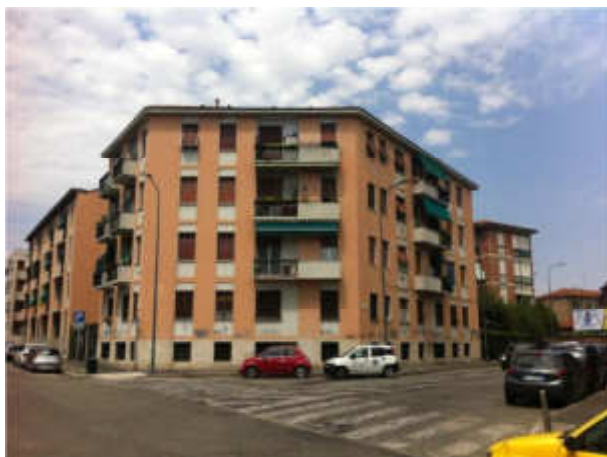
Stato di fatto prima dei lavori

E' stato scelto di completare l'intervento con un rivestimento silossanico , per le sue caratteristiche chimiche capaci di creare un film pittorico superficiale dall'elevata impermeabilità e idrorepellente, in quanto in condizioni di bagnato formano il cosiddetto "effetto goccia" grazie al quale l'acqua scivola via lungo le facciate e non penetra all'interno dei supporti. Perfezionano l'intervento il risanamento degli intonaci nelle porzioni di facciata non riscaldate e il rifacimento dei balconi .