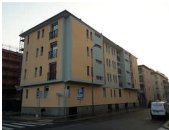
Dopo i lavori di riqualificazione

Il cantiere, della durata di meno di un anno, ha coinvolto 64 famiglie e una superficie di circa 5.100 mq di facciata coibentati tramite lastra in polistirene espanso sinterizzato (EPS) additivato con grafite, ISORAY® trenta , dell'isolante, spessore 12 cm, resistenza termica RD 4,00 ( m 2 K/W).