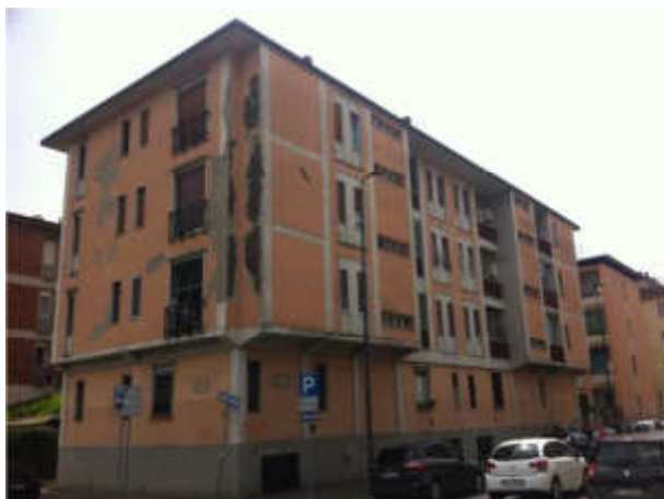
Stato di fatto prima dei lavori